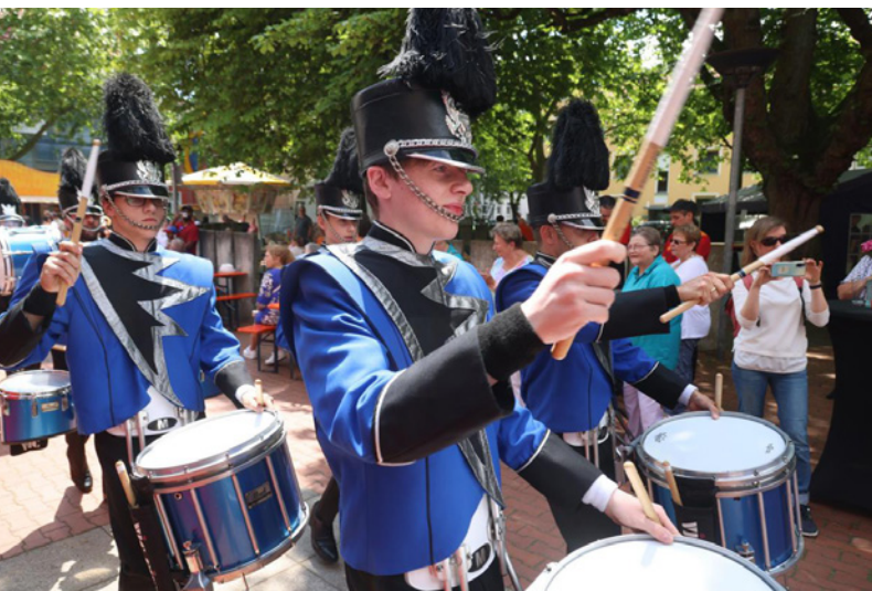
Bei allen Umzügen in Höchst war der Verein dabei

Mit der Teilnahme an der „ CHECK24 Truck Tour 2025 “ brachte die Gruppe ihre Energie erneut in große Arenen und spielte in Stadien wie dem Deutsche Bank Park, Fritz-Walter-Stadion und Signal Iduna Park. Große Kulissen, tausende Fans und ein zeitgemäßer, international geprägter Sound zeigen, wie sich die Schlossgarde weiterentwickelt hat, ohne ihre Wurzeln zu verlieren.