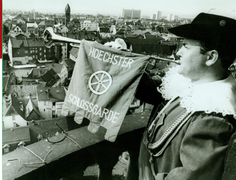
Mit Fanfaren vom Höchster Schlossturm wurde seinerzeit das Schlossfest eröffnet.

Internationale Workshops mit erfahrenen Coaches, zum Beispiel aus den USA, prägen den modernen Sound und unterstreichen den hohen Anspruch der Formation.